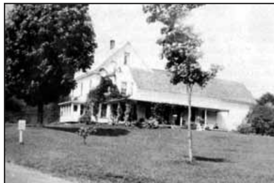
Wayside Inn - Dunkin

To learn more about this site, please read the leaflet Dunkin .