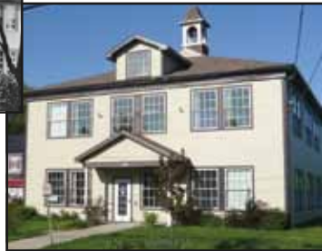
L'édifice du CLSC - CAB