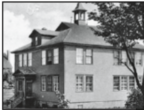
L'édifice de la Légion 1922

13 L'édifice du CLSC – Cet édifice est une réplique de celui de la Légion canadienne détruit en 2008. Construit en 1922, l'ancien bâtiment sert d'abord d'école primaire française. Des religieuses y enseignent jusqu'en 1955, année de la construction de l'école primaire du Baluchon.