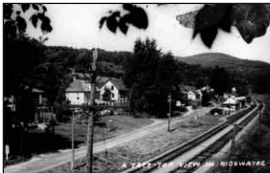
Highwater, circa 1850

Ce parcours offre des points de vue sur la rivière Missisquoi et les montagnes du Vermont.