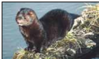
Loutre de rivière

La promenade riveraine – C'est avec beaucoup d'enthousiasme que la Fiducie foncière de la vallée de la Ruitier participe au projet de revitalisation des sentiers sur les berges de la rivière Missisquoi Nord, en juin 2004.