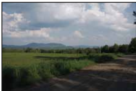
Plateaux montagneux, ch. Fitzsimmons

Ce chemin offre des vues spectaculaires des monts Éléphant, Owl's Head et Bear de même que des montagnes du Vermont.