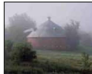
The Round Barn

The Round Barn and Place de la Grange-Ronde - The only round barn remaining in Potton today was cited as a historical monument by the Municipality in 2009. Only seven round barns still exist in the Eastern Townships. To learn more about this barn, please consult the leaflet The Mansonville Round Barn .