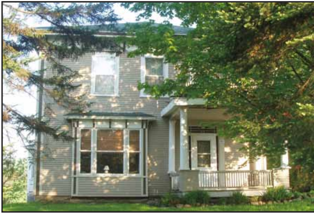
La maison au 283, rue Principale

7 L'édifice de la CIBC est construit en 1921 par la Canadian Bank of Commerce . À la suite d'une fusion en 1961, la banque devient la Canadian Imperial Bank of Commerce . Remarquez sur son fronton le premier logo de la Banque Canadienne de Commerce.