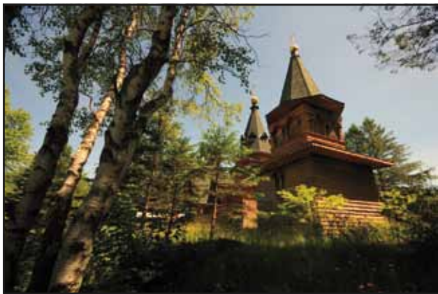
Le monastère orthodoxe russe

Il est possible de visiter les lieux en respectant leur caractère religieux. Le cimetière à l'ombre de l'église est le plus récent du canton.