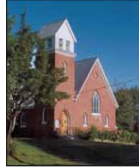
St.Paul's Anglican Church

Distinctive features of this gothic-style building are the tower belfry, the brick siding, the distinctive arched windows and the wood-siding at the top of the steeple.