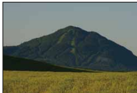
Owl's Head Mountain

Turn left on chemin du Mont Owl's Head to reach the parking at the base of the mountain, after 0,5 km.