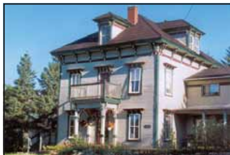
La maison Manson

Marchez sur la rue Mill en direction du pont enjambant la rivière, autrefois un pont couvert, et traversez le pont pour admirer un joyau architectural et patrimonial de Potton, la maison Manson.