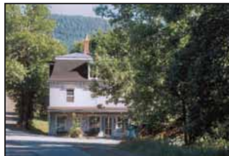
Jewett General Store

Immediately on your left, facing Jewett General Store, chemin George-R Jewett will lead you to the Vale Perkins dock, close by at 1,0 km.