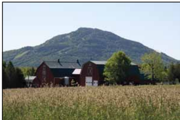
Owl's Head, vu du chemin Peabody

Après les courbes, remarquez les érables centenaires et les énormes pierres qui bordent ce pittoresque chemin longeant une ferme superbe. Les premières fermes établies sur ce chemin datent du début du XIX e siècle.