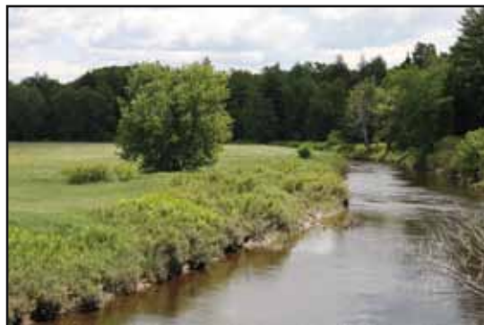
Missisquoi River - Highwater to Dunkin

A popular camp ground, the Carrefour des campeurs, is on your left at 1,4 km.