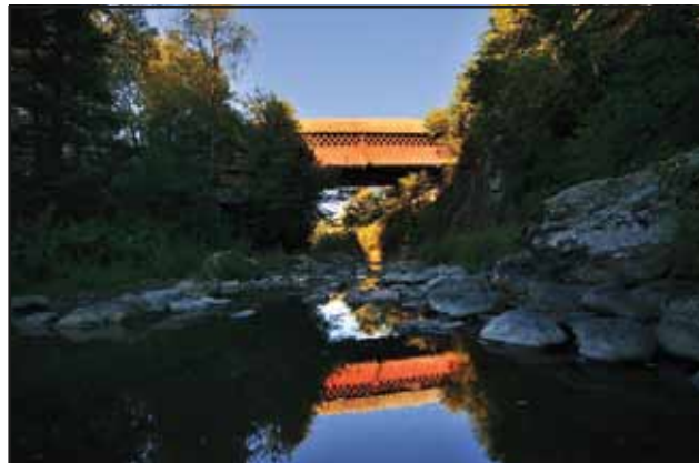
Pont de la Frontière 1896

The covered bridge is one of about ten remaining in the Eastern Townships. Built in 1896, it crosses over the Mud Brook. Covered wooden bridges of "Town" truss style, have very long life spans, as they are protected from the elements and adverse weather conditions.