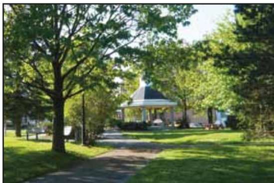
La place Manson

1 La place Manson Vers 1850, William Blanchard Manson offre une partie de sa terre au village de Mansonville, qui la transforme en terrain communal et y plante des arbres pour respecter les vœux du donateur. On y installe aussi un kiosque à musique. Avec les années, le parc voit disparaître ses arbres et son kiosque. En 1992, le conseil municipal redonne au parc son image d'antan et lui refait une beauté. Depuis, on y célèbre les fêtes du village et le parc fait la fierté des citoyens.