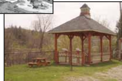
Place du moulin 2008