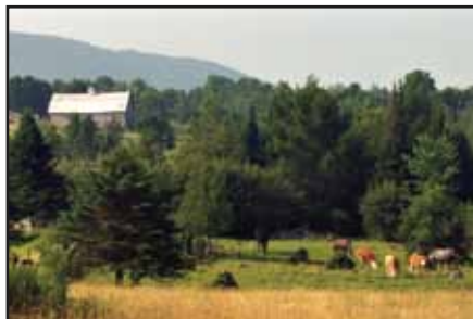
Pâturages – Chemin de Province Hill

Poursuivez votre route sur ce chemin pour admirer des panoramas de plateaux montagneux, sur l'horizon ouest.