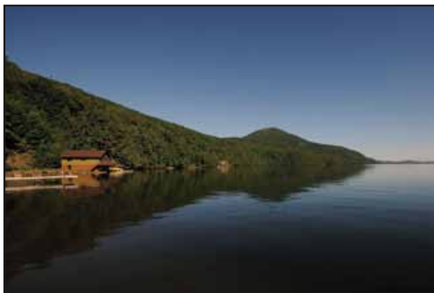
Le lac Memphrémagog, au quai de Vale Perkins

Maintenant, le quai grouille d'activités l'été, grâce à sa plage et à la mise à l'eau d'embarcations pour la navigation de plaisance et la pêche.