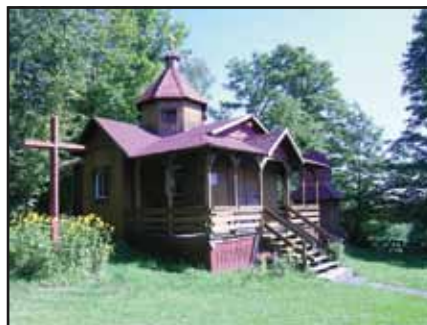
Vorokhta Ukrainian Chapel

To learn more, refer to the leaflet Knowlton Landing.