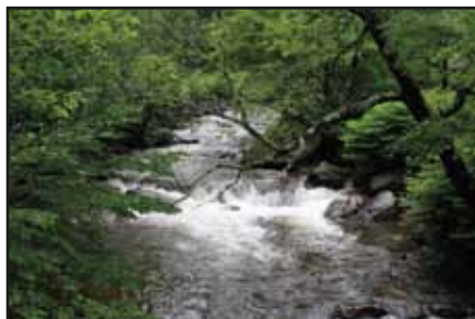
Le ruisseau Ruiter Brook

Tournez à droite sur le chemin Ruiter Brook.